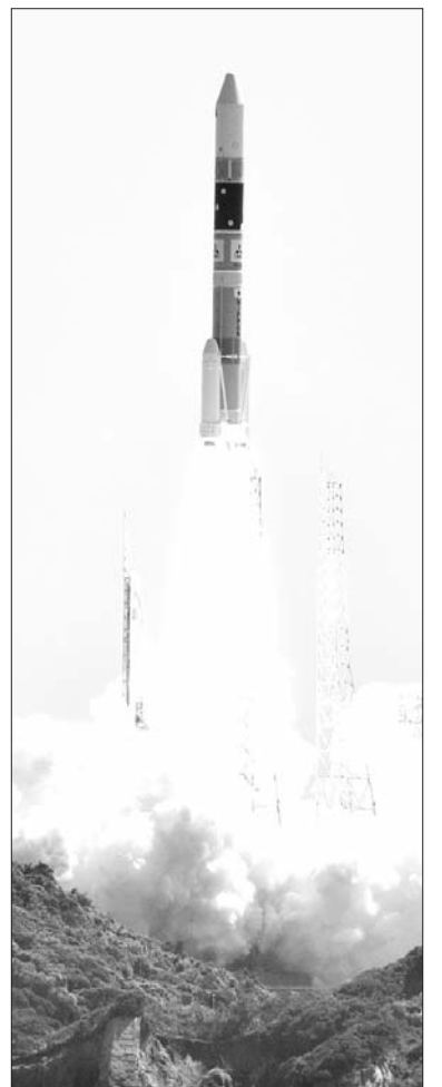
Сторінку підготував Андрій Яцик.

Супутник, оснащений двома радарними, буде збирати розвіддані, пов'язані з національною безпекою. Апаратура дозволяє йому робити це у високій якості навіть у нічний час або за поганої погоди.